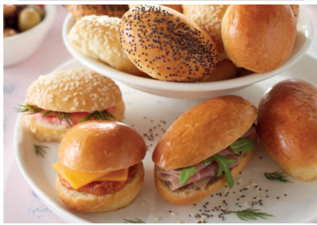
Suggestion de présentation / serving suggestion

Les navettes à garnir, une saveur délicatement briochée ! Elles sont le support idéal pour la réalisation d'amuse-bouches et autres accompagnements apéritifs.