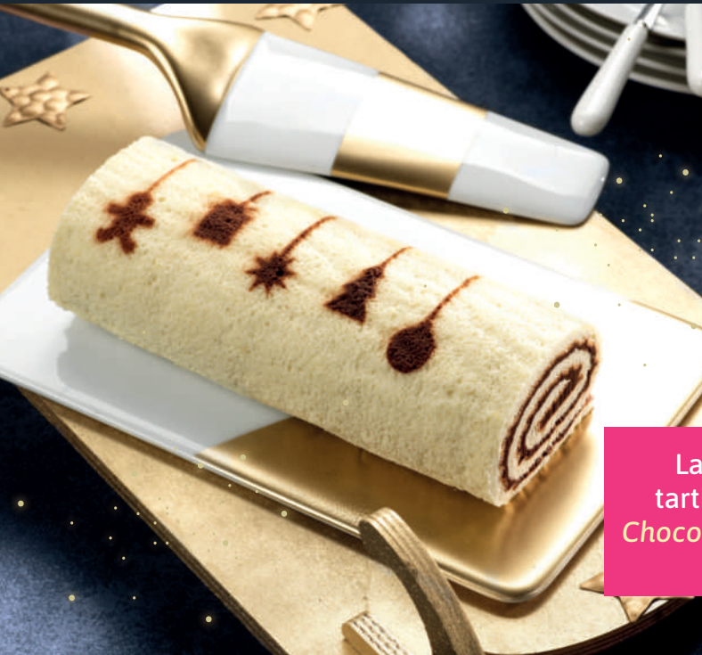
La bûche roulée pâte à tartiner noisettes et cacao Chocolate and hazelnut spread rolled log