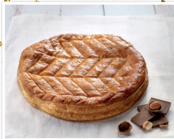
Exemple de réalisation / Recipe example