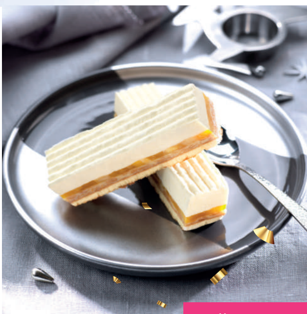
Allumette Cream cheese & Agrumes Citrus and Cream cheese Finger