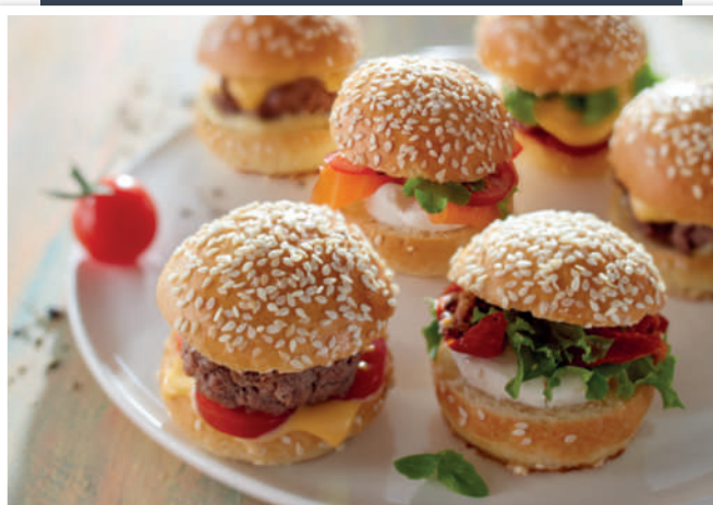
Suggestion de présentation / serving suggestion

Ready garnish brioche rolls. A subtle brioche flavour! They are perfect for making appetisers and other nibbles.